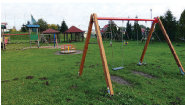
Sołectwo Przytocko doposażyło aż dwa place zabaw.