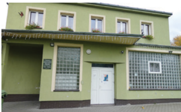
W filii biblioteki w Biesowicach wyremontowano i doposażono kuchnię.

W Pustowie przeprowadzono remont chodnika w centrum miejscowości. Blisko 280 m nowej inwestycji wykonano wspólnie z Zarządem Dróg Powiatowych w Słupsku. Sołectwo Pustowo przeznaczyło na ten cel środki z Funduszu Sołectkiego, a koszt zadania został podzielony po 50% wartości z Zarządem Dróg Powiatowych.