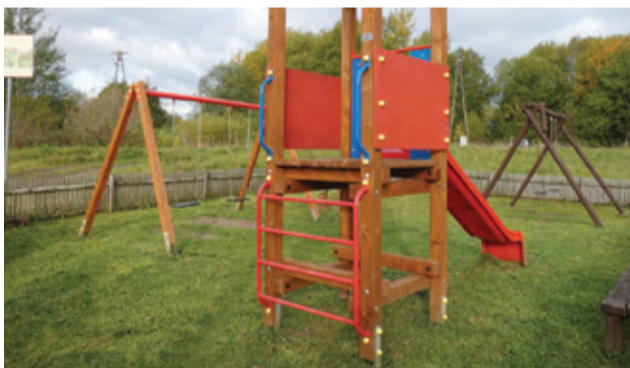
Nowe elementy na placach zabaw cieszą całe rodziny.