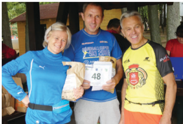
Zawodnikom towarzyszyły znakomite humory.