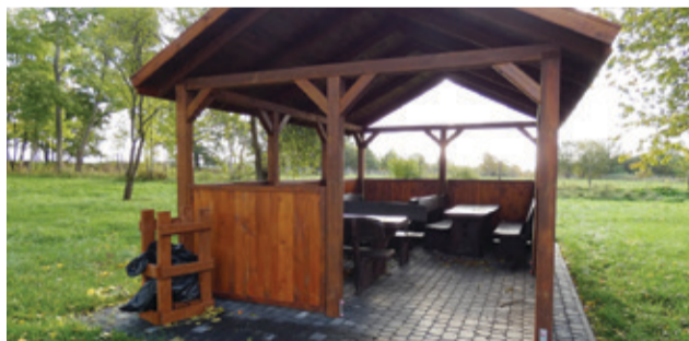
W Płocku mieszkańcy teraz spędzają wolny czas w komfortowych warunkach.