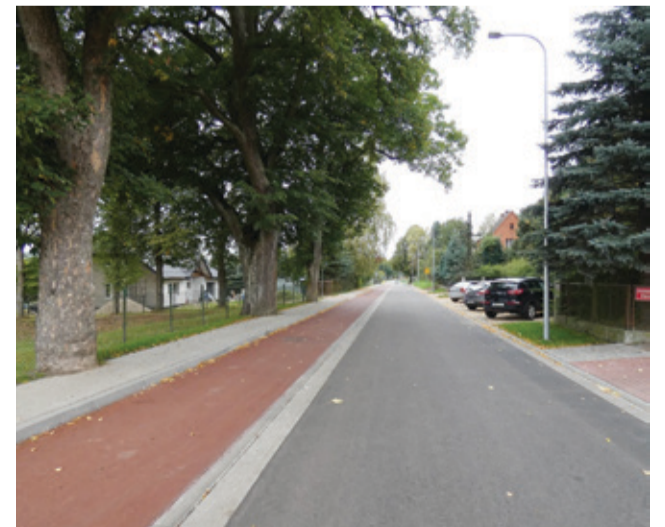
Oprócz nowej nawierzchni oraz chodnika, powstała także ścieżka rowerowa.