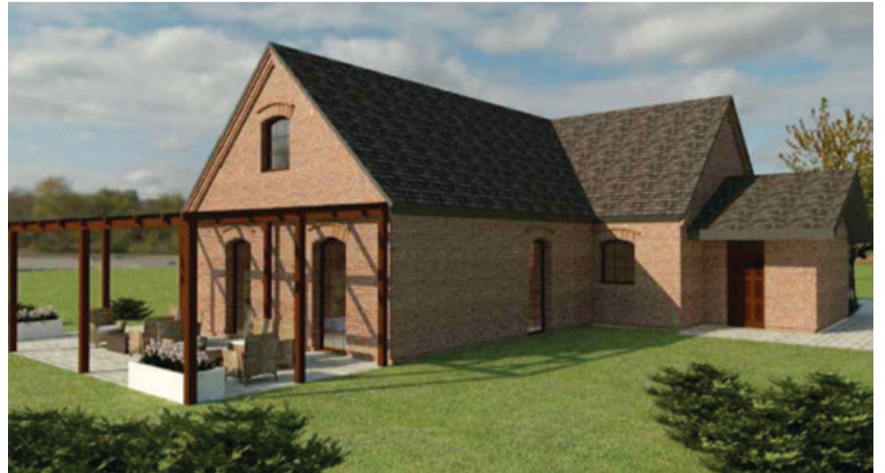
Wizualizacja zmodernizowanej filii biblioteczej w Osowie.

Oprócz wspomnianych efektów przebudowy, dodatkowo na dotąd niewykorzystywanym poddaszu zostanie wygospodarowany magazyn i pomieszczenie gospodarcze. – Zbudowany będzie taras przy obiekcie, służący jako zielona czytelnia (czytelnia na powietrzu), miejsce rekreacyjne, do działań animacyjnych i kulturalnych – dodaje dyrektor Borodziuk.