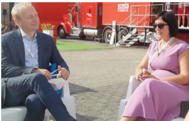
W trakcie Forum samorządowcy z różnych części kraju wymieniali się doświadczeniami.