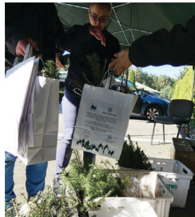
Przed Nadleśnictwem Warcino można było otrzymać sadzonki drzew i krzewów.