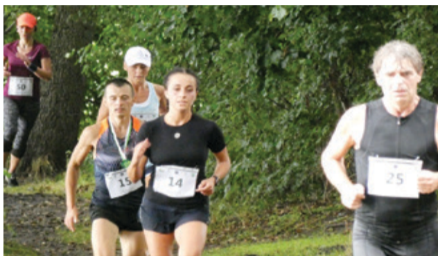
Trasa biegu liczyła 10 km i wiodła przez urokliwe tereny wokół jeziora Obłęskiego.

specjalnej loterii kilkanaście drzewek i krzewów ufundowanych przez szkółkę w Biesowicach. Organizatorami biegu była Gmina Kępice, KO-SiR oraz Nadleśnictwo Warcino.