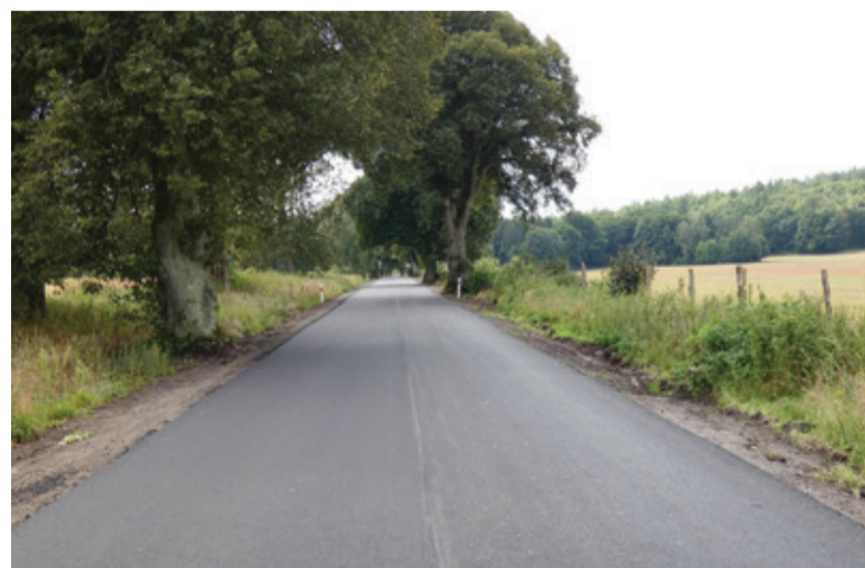
Kolejny wyremontowany odcinek drogi. Tym razem między Warcinem a Osowem.

Majewska. Zgodnie z kolejnymi deklaracjami, już wkrótce zostanie zmodernizowany chodnik w