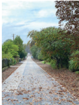
Odmieniona droga w Osowie.

mieniła wygląd tej części miejscowości. Prace przeprowadzono w ramach projektu pn. „Poprawa bezpieczeństwa i spójności dróg gminnych na terenie Gminy Kępice poprzez przebudowę dróg w miejscowościach Osowo i Warcino”, który otrzymał wsparcie finansowe z Funduszu Dróg Samorządowych.