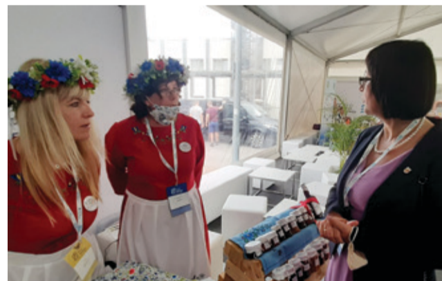
Przedstawiciele wielu regionów prezentowali swoją kulturę i lokalne produkty.