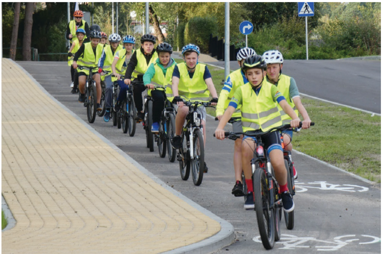
Rowerzyści z naszej Szkółki Kolarskiej prezentowali właściwe wzorce zachowania w ruchu drogowym.

Film powstał w ramach projektu współfinansowanego z Pomorskiej Rady Bezpieczeństwa