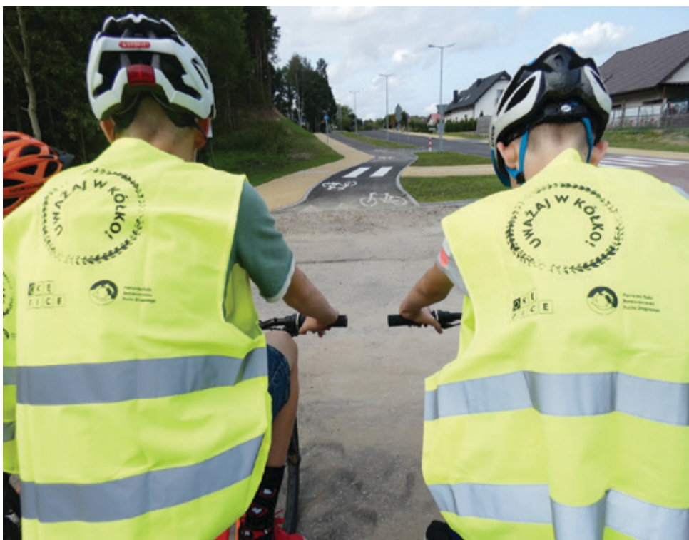
W ramach projektu zakupiono kilkadziesiąt kamizelek odblaskowych, które są sukcesywnie przekazywane rowerzystom i pieszym.

Film „Uważaj w kółko!” można obejrzeć na stronie internetowej www.kepice.pl , na stronie Facebook – Gmina Kępice oraz w serwisie YouTube.