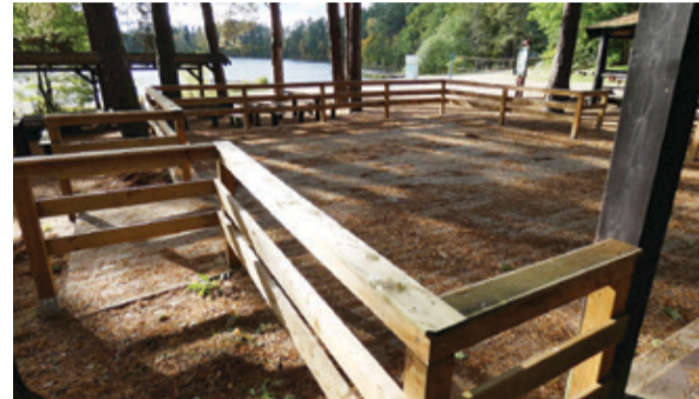
Nowy podest świetlicy wpisał się w istniejącą zabudowę turystyczno – rekreacyjną w Korzybiu.