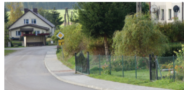
Nowy chodnik w Pustowie przyczynił się do poprawy estetyki miejscowości.