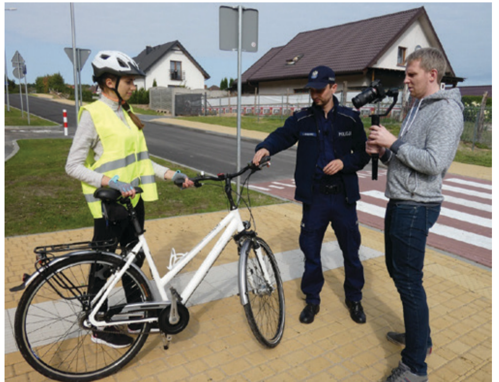
W realizację filmu edukacyjnego zaangażowali się m.in. pracownicy Urzędu Miejskiego w Kępicach oraz Komendy Miejskiej Policji w Słupsku.