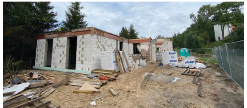
Aktualnie prowadzone prace budowlane.