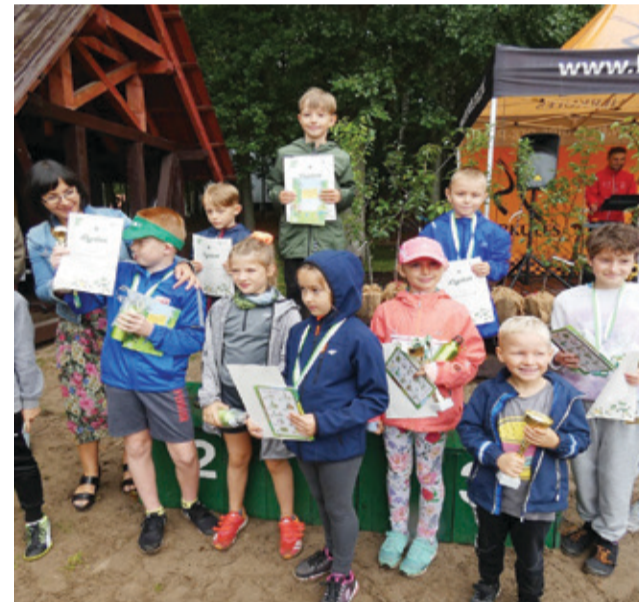
W specjalnym biegu „Zielona Jedynka” wzięli udział najmłodszy zawodnicy.