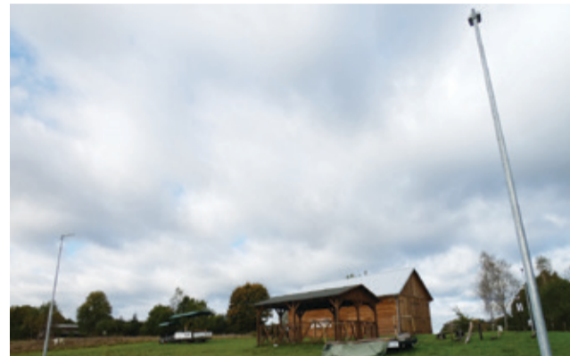
Nowe punkty oświetleniowe na terenie stacji drezynowej.