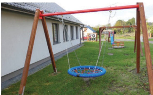
Doposażony plac zabaw przy filii biblioteki w Ciecholubiu.