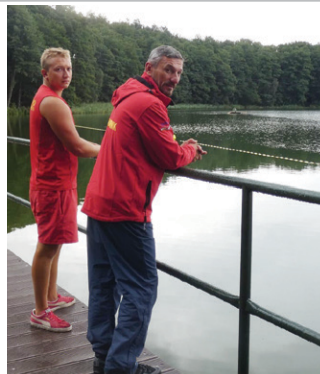
W okresie wakacyjnym na kąpielisku w Obłężu dyżur pełnili ratownicy.

- To bardzo przyjemne i urokliwe jezioro, jest tu świetnie przygotowana infrastruktura do wypoczynku. Spotkaliśmy tu wielu sympatycznych ludzi, którzy odnosili się do nas z dużą dozą serdeczności. Jesteśmy wdzięczni całej obsłudze ośrodka, która zawsze była miła i niezwykle uczynna. Z pewnością będziemy wspominać ten czas miło i ciepło.