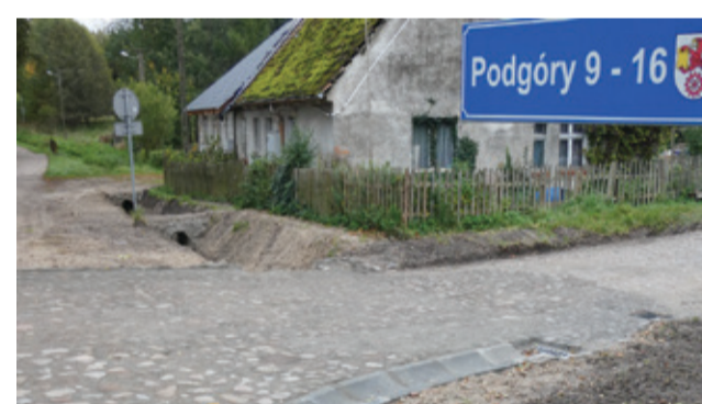
Remont przepustu w Podgórach usprawni przepływ wód opadowych.