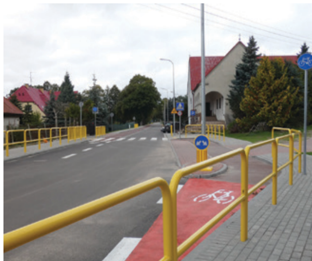
Zmodernizowana droga w Warcinie odmienną wizerunek tej części miejscowości

do posesji, ścieżką rowerową. Co równie ważne, w ramach modernizacji uruchomiona zostanie także sieć oświetleniowa z nowymi latarniami drogowymi. Prace zostały wykonane w ramach projektu pn. „Poprawa bezpieczeństwa i spójności dróg gminnych na terenie Gminy Kępice poprzez przebudowę dróg w miejscowościach Osowo i Warcino”. Przypomnijmy, że inwestycja zyskała 75-cio procentowe dofinansowanie z Funduszu Dróg Samorządowych 2020.