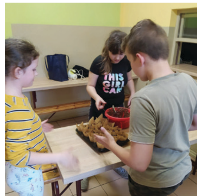
Uczniowie w trakcie zajęć.

Wtedy zostanie również uroczystie otwarta wystawa zdjęć wykonanych na konkurs fotograficzny oraz wręczenie nagród za wyróżnione prace.