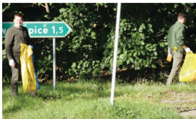
Podczas sprzątania okolicznych lasów.

podopiecznych to duża radość i przeżycie, że mogą przyczynić się do zwiększenia lesistości - dodaje.