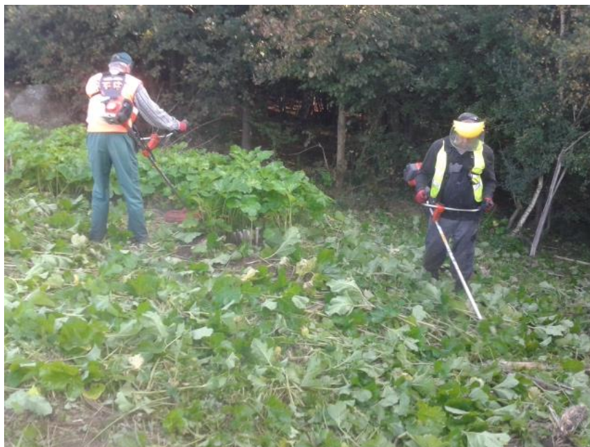
Zdj. 4 Pracownicy wykonawcy – Spółdzielni Socjalnej RAZEM podczas koszenia stanowisk barszczu Sosnowskiego