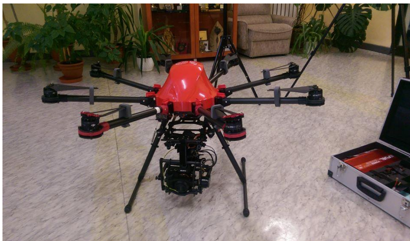
Zdj. 10. Dron

Warto wspomnieć, iż Spółdzielnia Socjalna „Razem”, której pracownicy zajmują się usuwaniem barszczu Sosnowskiego, w 2016 r. za swoją pracę, została nagrodzona statuetką Srebrnego Niedźwiedzia w konkursie Lider Promocji Słupskiej Gospodarki. Spółdzielnia została wyróżniona w kategorii: gospodarczy debiut roku (link do artykułu: http://www.gp24.pl/strefa-biznesu/wiadomosci/a/spoldzielcy-z-kepice-z-sukcesem-zakonczyli-2016-rok,11687316/ ).