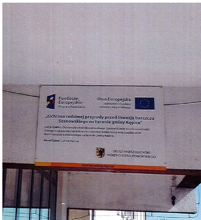
Zdj. 9. Tablica informacyjna przed budynkiem Urzędu Miejskiego w Kępicach