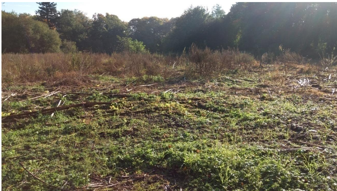
Zdj. 2. Zdjęcie barszczu Sosnowskiego po 4 oprysku