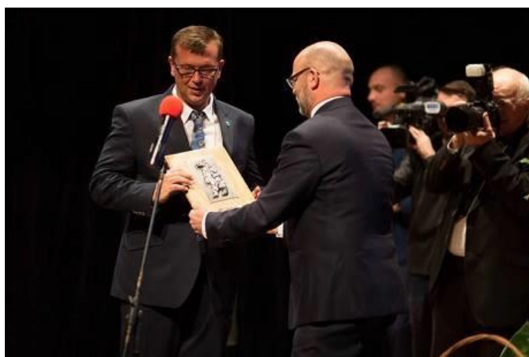
Zdj. 11 Prezes Spółdzielni Socjalnej RAZEM odbierający nagrodę Srebrny Niedźwiedź

Warto wspomnieć, iż Spółdzielnia Socjalna „Razem”, której pracownicy zajmują się usuwaniem barszczu Sosnowskiego, w 2016 r. za swoją pracę, została nagrodzona statuetką Srebrnego Niedźwiedzia w konkursie Lider Promocji Słupskiej Gospodarki. Spółdzielnia została wyróżniona w kategorii: gospodarczy debiut roku (link do artykułu: http://www.gp24.pl/strefa-biznesu/wiadomosci/a/spoldzielcy-z-kepice-z-sukcesem-zakonczyli-2016-rok,11687316/ ).