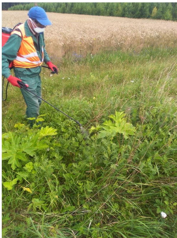
Zdj. 4 Pracownicy wykonawcy – Spółdzielni Socjalnej RAZEM podczas prysku chemicznego stanowisk barszczu Sosnowskiego